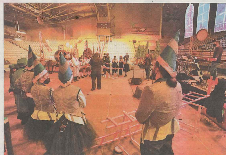
Imatge de l'assaig general celebrat ahir

Cançoner Popular de Catalunya i 150 anys de la Fundació de l'actual Ateneu Barcelonès) i tres personalitats (100 anys del naixement de Francesc Català-Roca, fotògraf; 100 anys del naixement de Gabriel Ferrater i Soler, poeta, crític, traductor i lingüista; 100 anys del naixement de Joan Fuster i Ortells, escriptor, intel·lectual).